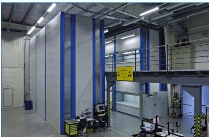
Zařízení Shuttle řídí software Kardex PowerPick 5000 napojený na centrální řídicí systém Brain.