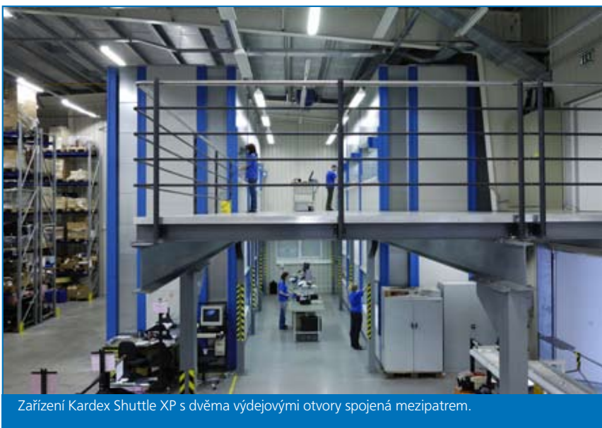
Zařízení Kardex Shuttle XP s dvěma výdejovými otvory spojená mezipatrem.