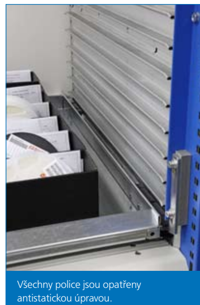
Všechny police jsou opatřeny antistatickou úpravou.